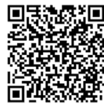
觀光管理系 07-381-4526 #17233